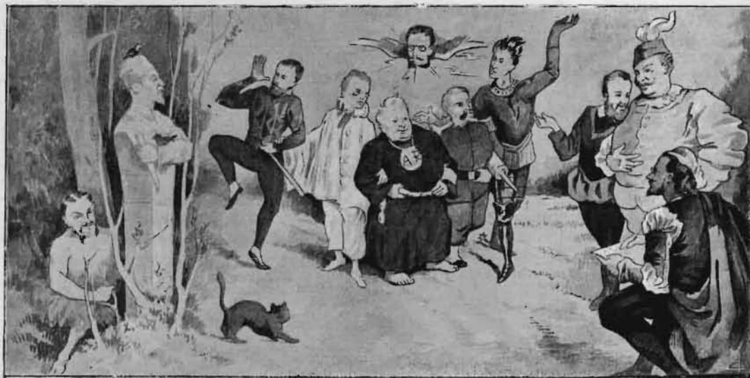
Fig. 5. — La salle de garde de La Pitié, en 1877.

qu'un collègue ou un peintre dessine sur les murs ou applique sur l'armoire de l'interne. Ainsi