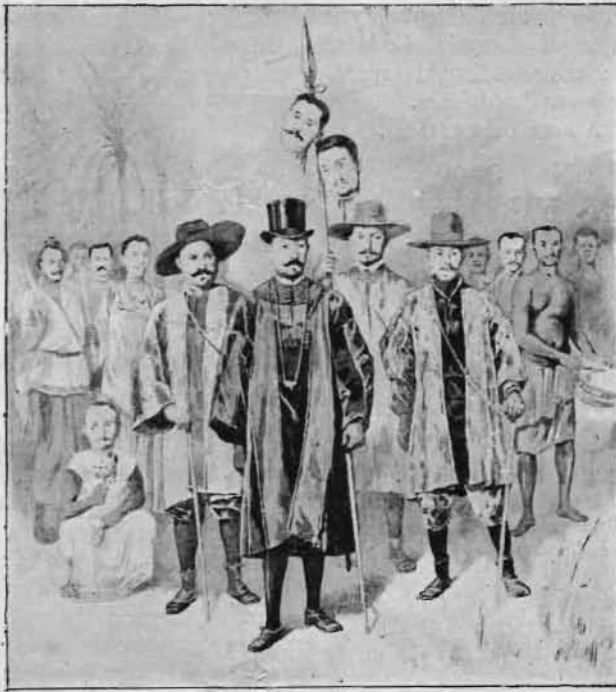
Fig. 1. — Les internes de La Charité en Dahoméens (année 1895-1894).