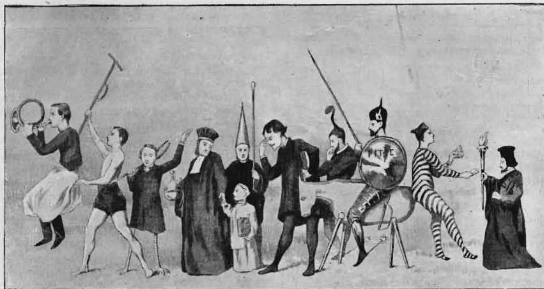
Fig. 2. — Salle de garde de La Pitié, en 1859.

rieur d'un cochon. C'est encore à cette salle de garde qu'est conservé l'humoristique dessin du Dr Essbach. Il représente son maître, le professeur Potain, partant pour la croisade. Souvent