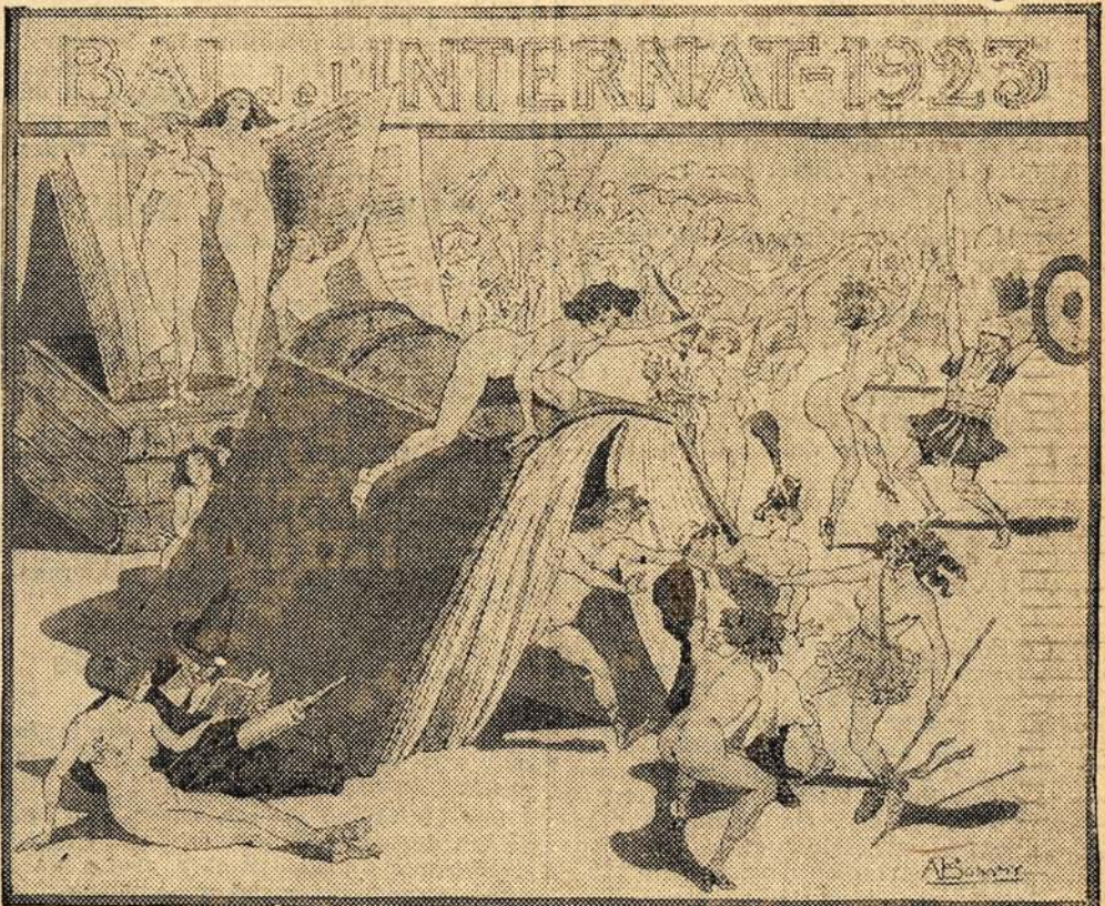
La carte d'invitation pour homme

Il est à craindre que la littérature contemporaine soit mal représentée. Oh! comme sont tristes nos romans contemporains; peut-