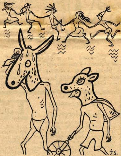
La Bête à Concours et le Fils du Patron.

Mais c'était pour une raison bien particulière. Vous êtes-vous jamais trouvé, à six heures du matin, sur le trottoir de l'avenue de